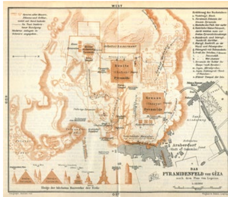
Fig. 2: Kart fra 1913 som viser landsbyen Kafr el-Haram ved pyramidene utenfor Kairo

hvor vi forsøker å kartlegge handelen i et historisk perspektiv med fokus på årene 1880-1930, en periode som kan beskrives som en gullalder for både den lovlige og den ulovlige handelen med egyptiske antikviteter.