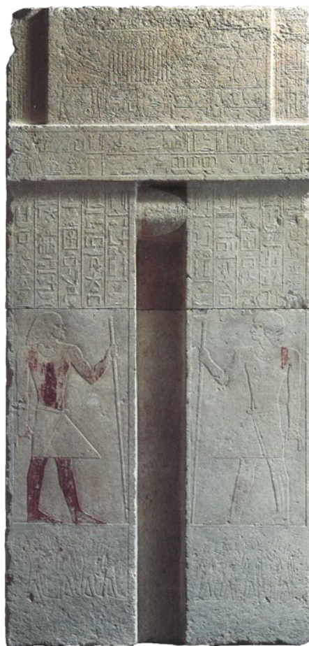
Fig. 4: Deler av Kaemremets kapell i Sakkara, kjøpt via den egyptiske antikvitetsjenersten i 1911, som i dag kan sees på Glyptoteket (inv. nr. ÆIN 1271).