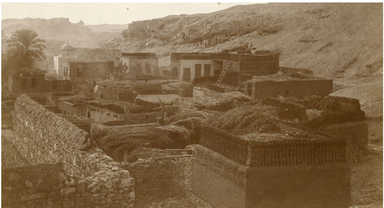
Fig. 3: Bilde av landsbyen Kafr el-Haram tatt av Jonna Lange, 1899

Denne kartleggingen av markedet har resultert i en liste over forhandlere som er aktive i Egypt ca. 1880-1930, og hvordan de var knyttet sammen i forskjellige nettverk. Mye av den ulovlige handelen i Kairo kunne for eksempel spores tilbake til en liten landsby ute ved pyramidene i Giza (fig. 2-3), Kafr el-Haram, hvor et par familier stod bak en stor del av omsetningen på det illegale markedet. Innbyggerne her hadde kort vei til en nesten uuttømmelig kilde til antikviteter – de enorme gravplassene fra Det Gamle Riket (ca. 2500 f.Kr.) rundt pyramidene var nærmeste nabo – og de hadde i flere generasjoner forsynet vestlige samlere og muséer med objekter.